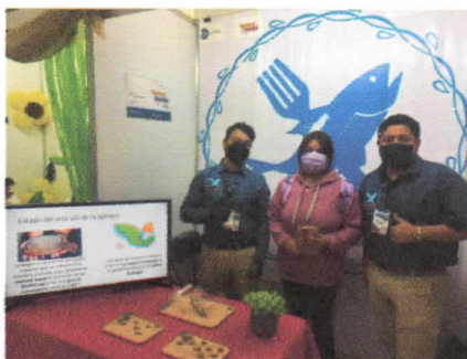
Figura 3. Venta del producto elaborado a partir de tilapia adicionado con harina de grillo con bajo contenido de sodio, en el segundo día de exposición.