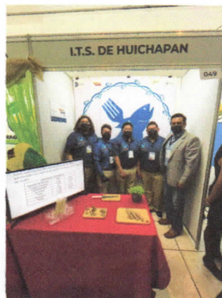
Figura 2. Presentación del prototipo por parte de los integrantes del equipo al jurado calificador del evento.