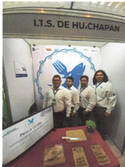
Figura 1. Presentación del Stand correspondiente al primer día de exposición