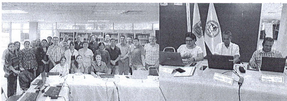
Superior de Huichapan