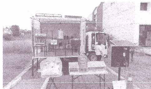
Fotografías durante el evento